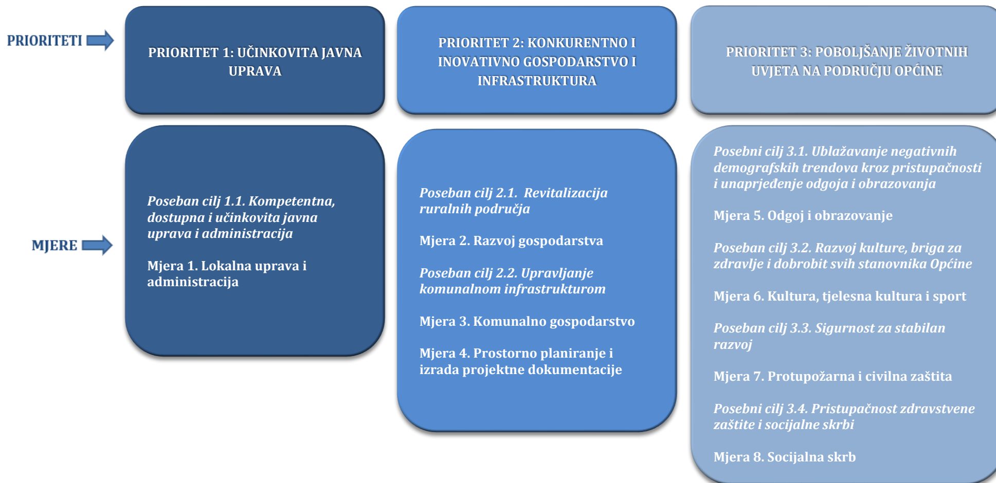
Slika 2. Pregled temeljnih strateških prioriteta i mjera

Izvor: Općina Kaštelir – Labinci – Castelliere – S. Domenica